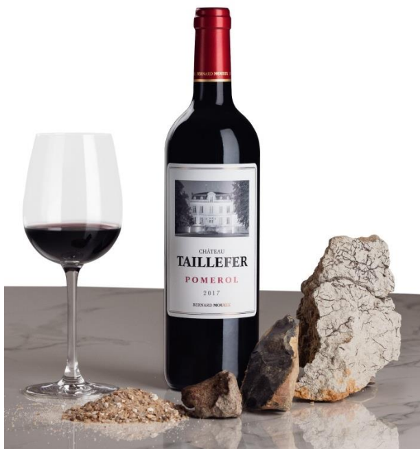
Silice, oxyde de fer, grave et argile bleue composent le terroir du Château Taillefer

Les anciens racontent que la charrue y « taille le fer » tant elle en soulève dans ce vignoble.